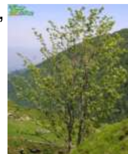
Sorbier des oiseaux

Préconisations : maintien de la diversité des milieux, notamment fruticées (pruneliers, sorbiers, ronciers) et maintien ouverture (sur genêts, fougères). Régulation des pionniers (bouleaux, pins).